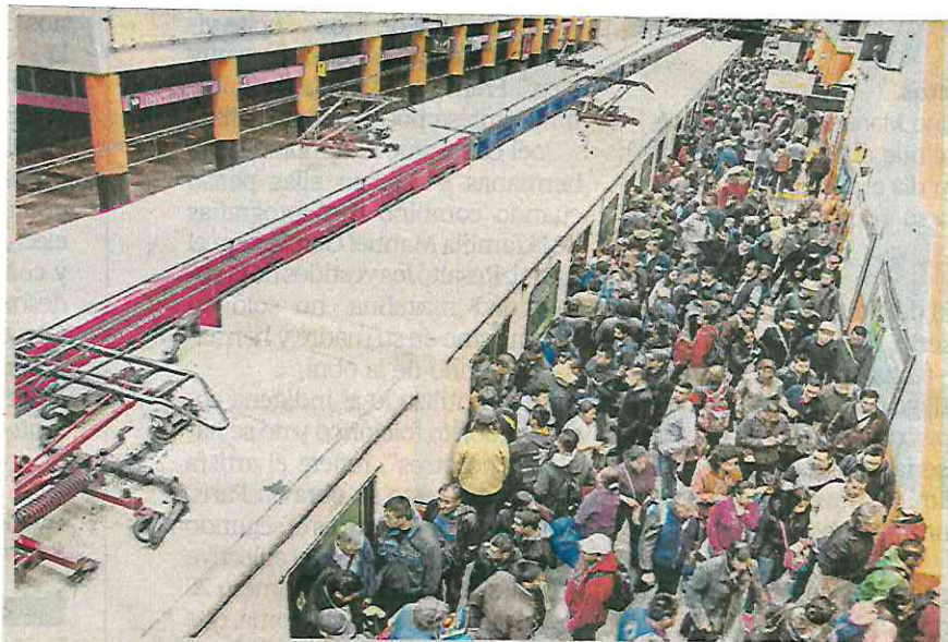
La Línea A inició operaciones en agosto de 1991. Con ella el Sistema de Transporte Colectivo (STC) Metro unió al Estado de México con el oriente de la capital.

Mientras esto sucede, millones de personas seguirán caminando por este laberinto en el oriente de la Ciudad, donde los remolinos ya no son de agua, como en sus inicios, sino de gente. ●