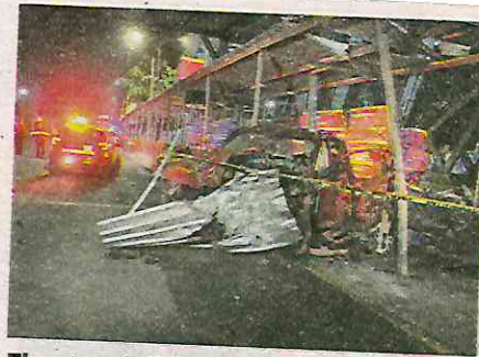
El automóvil quedó destrozado

Tras presenciar el percance, otros conductores frenaron su marcha y llamaron a los números de emergencia pa-