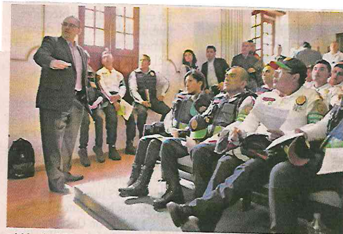
■ Más de 250 vigilantes y personal del Metro tomaron el curso.

“Capacitamos al personal de vigilancia y a las brigadas de respuesta para que ellos sepan identificar tres datos muy importantes sobre el infarto cerebral y eso lo rela-