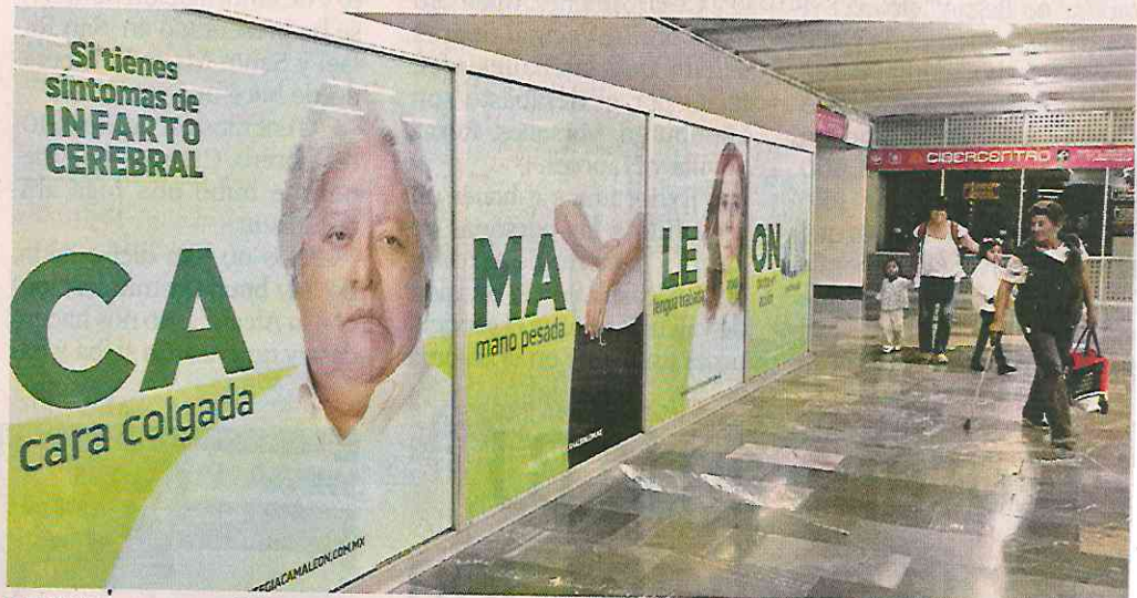
El STC busca sensibilizar a los usuarios con una campaña en la estación Tacubaya de la Línea 1.

En abril, REFORMA reveló que personal de vigilancia desalojó a la mujer de 56 años de las instalaciones de la estación Tacubaya y la abandonó en la banqueta de la Línea 1, donde permaneció unas 26 horas a la intemperie, tirada y sin poder pedir ayuda.