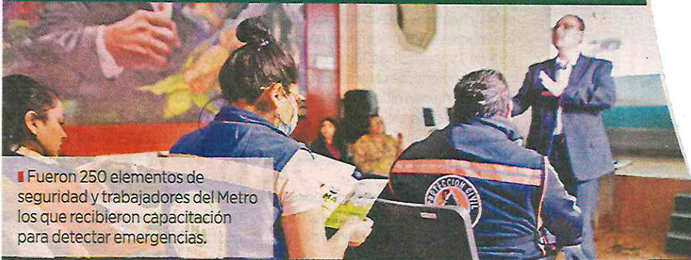
■ Fueron 250 elementos de seguridad y trabajadores del Metro los que recibieron capacitación para detectar emergencias.