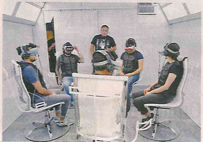
■ En una sala anexa los participantes viven 10 minutos de adrenalina pura. La sesión no es apta para personas cardiacas.

sido exhibida en diferentes países y se realiza en colaboración con la Secretaría de Cultura de la Ciudad de México.