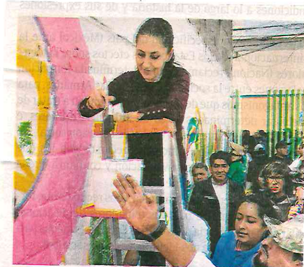
La mandataria inauguró ayer un PILARES en Iztapalapa

SE MEJORARÁ la iluminación y se colocarán botones de auxilio y alerta sonora