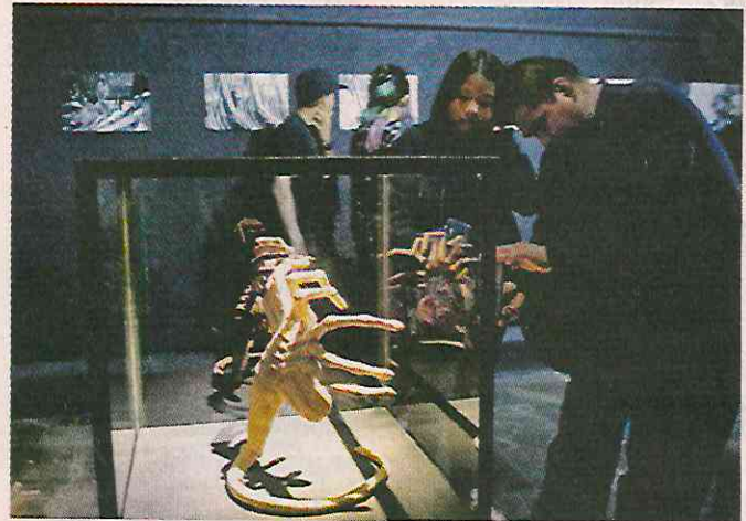
■ Maquetas y diagramas de cómo funciona el emblemático extraterrestre fascinan a los asistentes a la exposición.

Este montaje se realiza de forma paralela a la exposición de "Solo con la Noche" en una galería sobre la Avenida Reforma, la cual ha