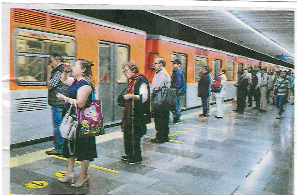
La capacitación fue dirigida a todos los empleados que tienen contacto con los usuarios

Un infarto cerebral puede ocurrir en cualquier sitio y por desconocimiento existe la posibilidad de que no sea atendido a tiempo